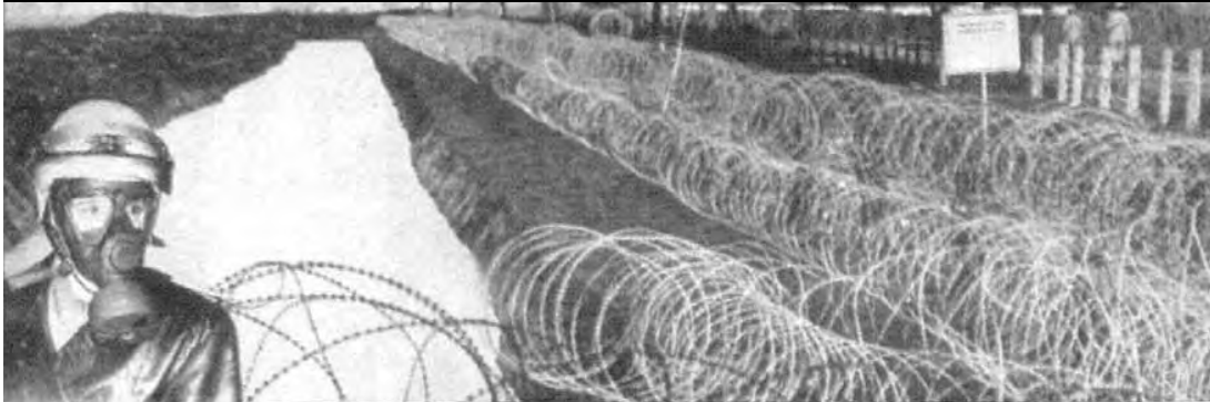
...UND SEINE INNERE SICHERHEIT